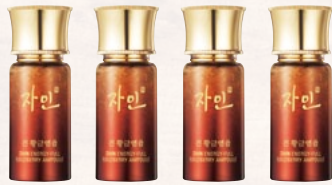
자민 생기진 황금 앰플 [주름개선 기능성] 15ml×4ea / 320,000원

고농축으로 함유된 황금 홍삼과 천정팔진단, 녹용, 장뇌삼, 용안 등 13가지 고귀한 약재가 피부에 진한 영양을 선사하고 골드성분의 금사로 피부를 탄탄하게 케어하는 2단계 황금 앰플. 황금 홍삼의 기운이 깃든 앰플이 추위와 바람에도 생기를 유지할 수 있는 건강한 피부로 가꿔 준다.