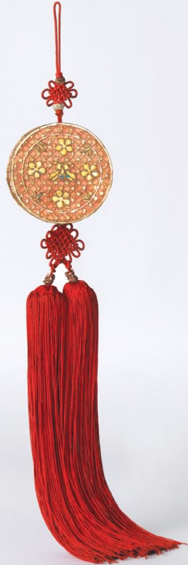
도금향갑노리개 鍍金香匣佩飾 조선 19세기 | 전체길이 34cm 코리아나 화장박물관 소장