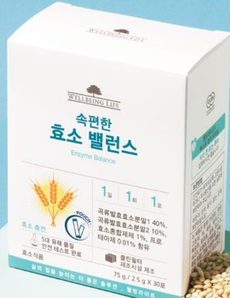
웰빙라이프 속편한 효소밸런스 2.5g×30포 / 65,000원(1개월 분)