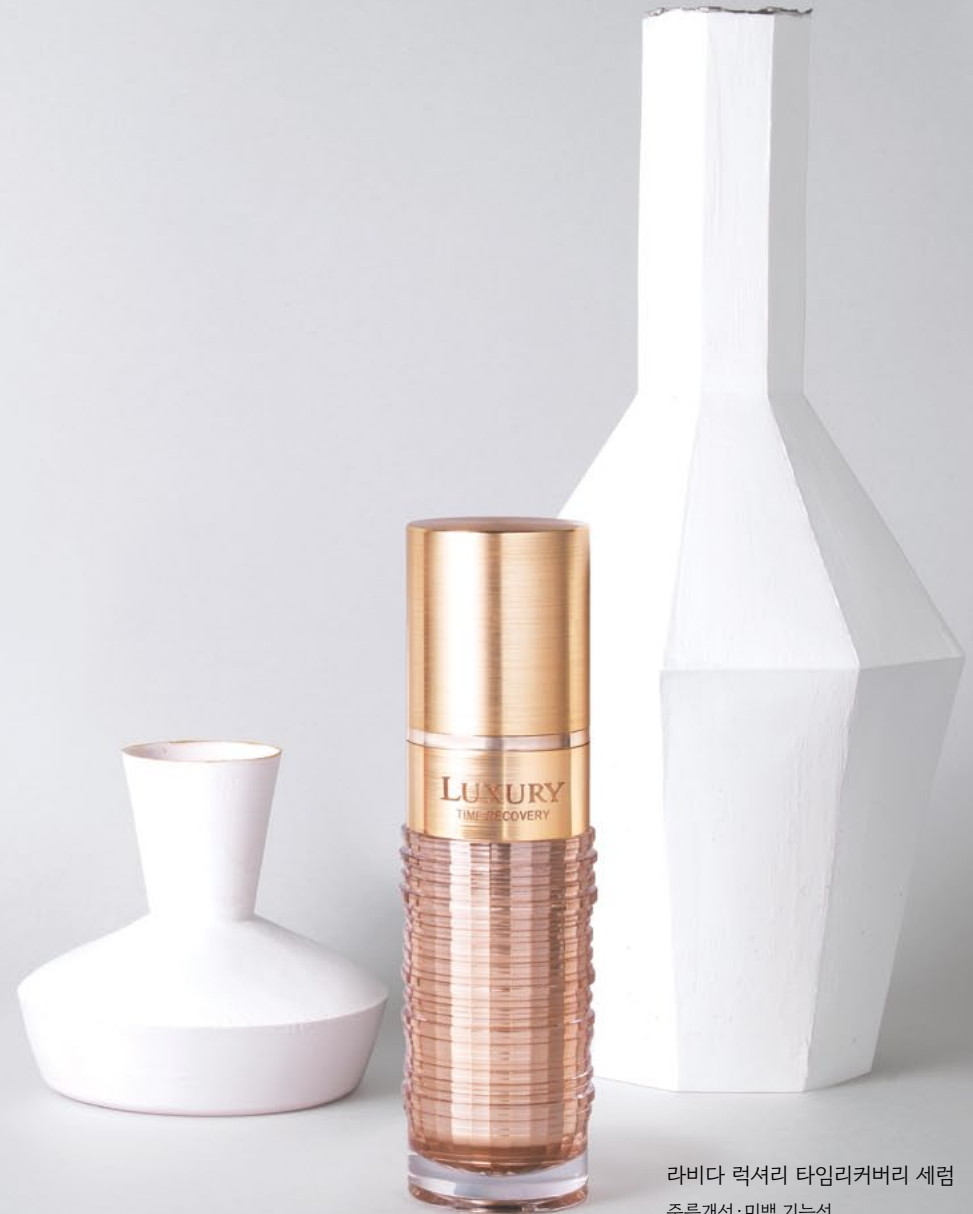
라비다 럭셔리 타임리커버리 세럼 주름개선·미백 기능성