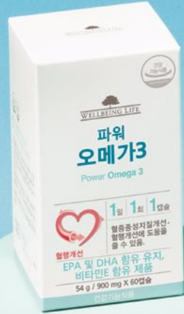
웰빙라이프 파워 오메가3 900mg×60캡슐 / 60,000원(2개월 분)