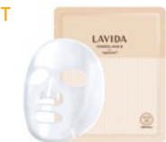
라비다 파워셀 마스크 에스 [주름개선 · 미백 기능성] 25ml×6ea / 48,000원