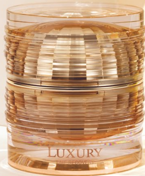
라비다 럭셔리 타임리커버리 아이크림 [주름개선·미백 기능성] 25ml / 280,000원

시간의 흐름과 피로, 스트레스의 영향을 가장 빨리 받는 눈. 얇고 섬세해 환경에 민감하게 반응하는 이 부위를 위해 봄에는 더욱 럭셔리한 아이케어가 필요하다.