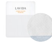
라비다 비타민 씨 솔루션 필링패드 5mlx10ea / 38,000원