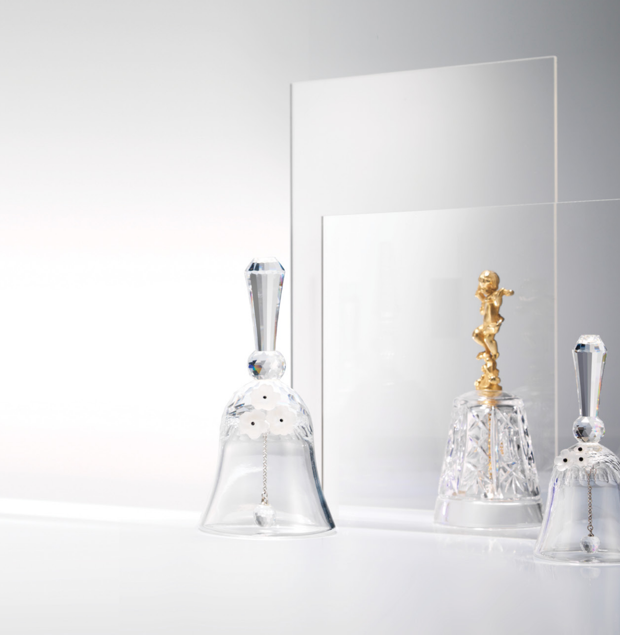
크리스탈 종 (Crystal Bell) 兪相玉 회장 소장