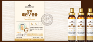
웰빙라이프 발효 태반 V 앰플 20ml X 30명 (1개월 분) / 250,000원