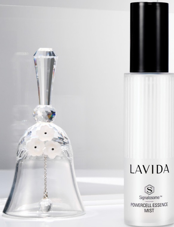
라비다 파워셀 에센스 미스트

발행일 2019년 7월 1일 | 동전 제 205호, 발행인 유영수 | 등록번호 창안 마 00009 | 발행처 (주)코리어나 화장품 경기도 수원시 영통구 센트럴타운로 114-4 (이화동) 031-722-7000 디자인 컨셉 기획 (주)스위치 크리에이션 경기도 분당구 판교역로 231 H&A타워 5층 7038, 02-9476-1944 | 출력&인쇄 (주)두경영앤피 대표전화 031-722-7000 | 고객센터실 080-022-6013 | http://www.beautycenter.co.kr | 상담가능시간 오전 9시~ 오후 6시 (주말 공휴일 제외) 서울(역삼) 1644-0655 | 서울(홍대) 02-3141-7001 | 경기(수원) 031-251-4521 | 대전/충청 042-263-9414 | 부산/경남 051-441-7750 대구/경북 053-256-6163 | 광주/호남 062-352-0173 | 강원 033-646-7240 | 제주 064-702-2133 * 본 책자에 게재된 사진과 글은 (주)코리어나 화장품과 (주)스위치 크리에이션의 저작권 보호를 받으며 사전 동의 없이 사용할 수 없습니다. 고객님의 소중한 의견을 기다립니다. 코리어나 뷰티가이드 (Colour)에 대한 의견이 있으시면 switch@switchon.co.kr 로 보내주시기 바랍니다.