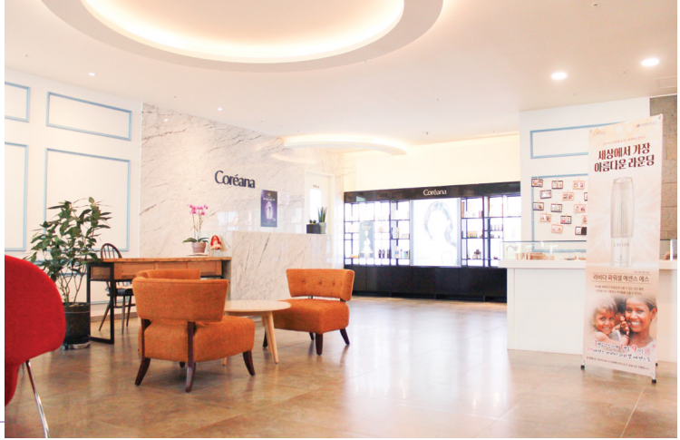
코리아나 뷰티센터 전주점