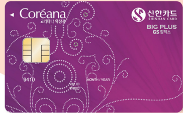
신한 코리아나 화장품 빅 플러스 GS칼텍스 카드

3대 백화점(롯데,현대,신세계) 및 롯데마트 5% 결제일 할인 국내 유명 레스토랑 및 커피숍 할인 (빈스아웃백,투썸플레이스 등) 에버랜드,롯데월드,서울랜드 50% 할인 박승철 헤어스튜디오, 박준 뷰티랩 20% 할인 S-OIL 주유시 리터 당 60원 적립