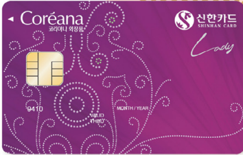
신한 코리아나 화장품 LADY 카드