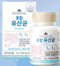
웰빙라이프 바이탈 솔루션 혼합유산균 350mg x 60캡슐 (2개월 분) / 70,000원

당근, 시금치, 양파, 브로콜리, 케일 등 5가지로 구성된 파이토케미칼(부원료) 컴플렉스가 더욱 건강한 신체의 생리활성을 돕는다.