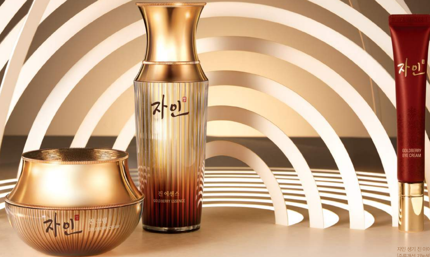
자인 생기진 크림 [주름개선 기능성] 50ml / 150,000원

주름진 눈가 굴곡을 매워 주며 강한 생명력의 장뇌삼이 탄력 있고 또렷한 눈매로 다듬어주는 고기능성 아이크림. 피부 순환에 도움을 주는 백자순환병으로 눈가를 가볍게 마사지하면 한결 눈 주위가 맑아진다.