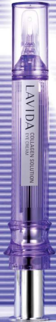
라비다 콜라겐 솔루션 아이 크림 [주름개선 기능성] 10ml x 2ea / 88,000원