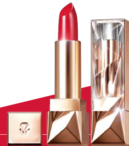
16호 도발레드 라비다 루미너스 솔루션 쉬머리프트™ 립스틱 30,000원

Lip 라비다 루미너스 솔루션 쉬머리프트™ 립스틱 16호 도발레드를 풀발색으로 바르되 라인은 흐트러지듯 발라준다.