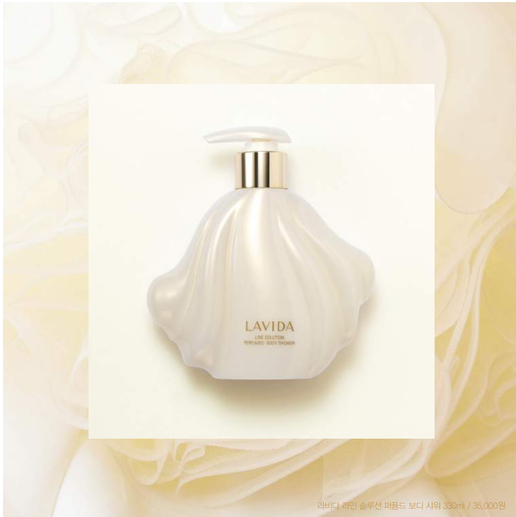
라비다 라인 솔루션 퍼ഫ뎀드 보디 샤워 330ml / 35,000원

하루가 다르게 건조해지는 가을, 보디 피부에도 특별한 보습을 준비해야 할 때다. 은은한 향기의 라비다 라인 솔루션 퍼ഫ뎀드 보디 라인으로 더욱 매력적인 가을 여인으로 변신해보자.