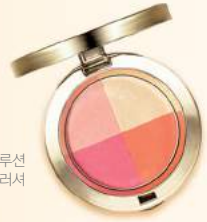
라비다 루미너스 솔루션 쉬머리프트™ 블러셔