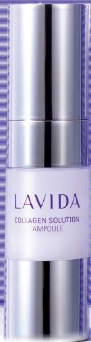
라비다 콜라겐 솔루션 앰플 [주름개선 기능성] (8ml+80mg) x 4ea / 350,000원

눈가나 팔자주름, 이마 등 표정주름이 쉽게 자리잡는 부위일수록 콜라겐의 파워는 절실하다. 눈가 탄력을 책임지는 아이 크림, 총알처럼 빠르게 작용하는 앰플로 한번 더 콜라겐을 레이어링할 것. 부족한 콜라겐을 채우고, 그 위에 성을 쌓듯 다시 콜라겐을 겹겹이 더하면 피부의 탄력은 사라질 틈이 없을 것이다.