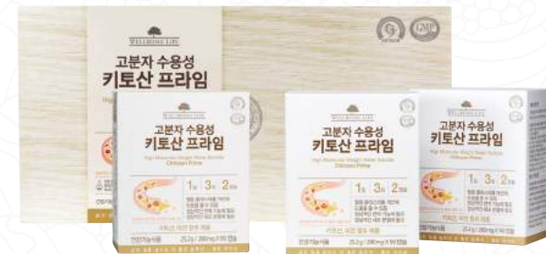
웰빙라이프 고분자 수용성 키토산 프라임 280mg x 270캡슐 (45일분) / 390,000원