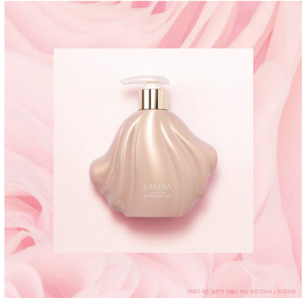
라비다 라인 솔루션 퍼ഫ뎀드 보디 로션 330ml / 35,000원