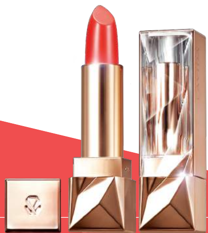
15호 차밍코랄 라비다 루미너스 솔루션 쉬머리프트™ 립스틱 30,000원

Lip 라비다 루미너스 솔루션 쉬머리프트™ 립스틱 15호 차밍코랄을 풀 커버로 발라 러블리하면서도 투명한 이미지의 메이크업으로 마무리한다.