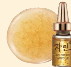
자인 생기 진 황금앰플 [주름개선 기능성] 2ml x 28ea / 320,000원